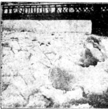
DE DONAU BEVROZEN I De Donau, bedekt met gewelgige ijsschollen, drijft de rivier door de stad. — Prachtig is het uitzicht op de rivier, met de stad in de verte, en de groene hellingen van de rivierkanten.