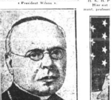
KARDINAAL VICO Een van de belangrijkste bisschoppen van de kerk.