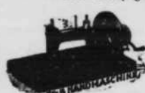
Vijf jaar gewaarborgd.

Deze naamachines zijn door geheel Europa bekend als de beste, vermits zij bekroond zijn met de gouden medaille op de tentoonstelling van Amsterdam.