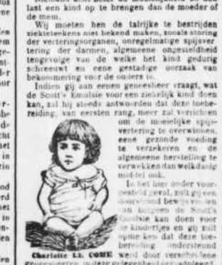
Levallois-Perrot (Senen), Frankrijk, 21 Juni 1897.

UN PRODUIT NOUVEAU Tous nos lecteurs connaissent les merveilleux produits de l'État de Vichy, dont les sources appartenant à l'État français sont devenues si