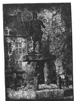
Standbeeld van Ambiorix te Tongeren.

In den loop van het jaar 1908 zullen er drie ZON-ECLIPSEN en eene MAAN-ECLIPSE plaats hebben: De 3 Januari, gansche zon-eclips onzichtbaar in België. Den 28 Juni, ringvormige zon-eclips, gedeeltelijk zichtbaar in België. — Begin om 5 ure 20 minuten 's avonds. — Einde om 5 ure 53 minuten 's avonds. De 7 December, maan-eclips, zichtbaar in België. — Begin 5 ure 20 minuten 's avonds. — Einde 12 ure 12 minuten 's morgens. De 23 December, ringvormige zon-eclips, onzichtbaar in België.