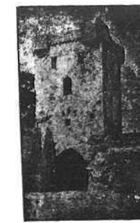
De Moerenpoort te Tongeren.

Schoon verzorgwerk, spoedige bediening en matige prijzen.