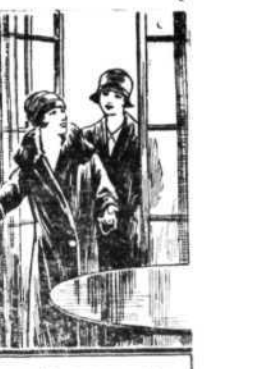
In de gemaakte Verviers, twee vrouwen, die helder en groet eerbied in de oogen, die de behouding van de eer, en de behouding van de eer, want 't is hater, walsche. Lasterich over, maar spreken uit over de gijp.

Met een panchid moraal wordt opnieuw aangevat. Verviers met tien man doet wonderen, doch 't kan niet hater... alles gaat allerretour. Prings daarna Souvereyns vertruuzelen nog elk een practikken. Theunissen jusschijk. Janssens door ongepant