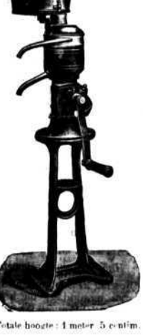
Totale hoogte: 1 meter 5 centim.

van MIELE & Co. Nijveraars, 33 Gemeentplaats, Sint-Pieters-Jette. (Tram Brussel-Beurs naar Jette, vertrek alle drie minuten.) Handelsbestierder: RAOUL PETIT-SEGHERS.