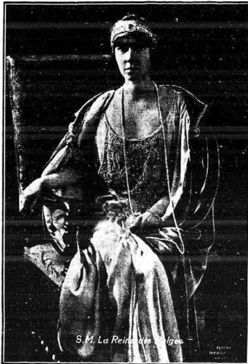
H. M. ELISABETH, Koningin der Belgen.