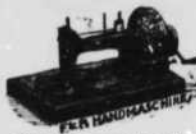
Vijf jaar gewaarborgd.

Deze naamachiemen zijn door geheel Europa bekend als de beste, vernutts zij bekroond zijn met de gouden medaille op de tentoonstelling van Amsterdam.